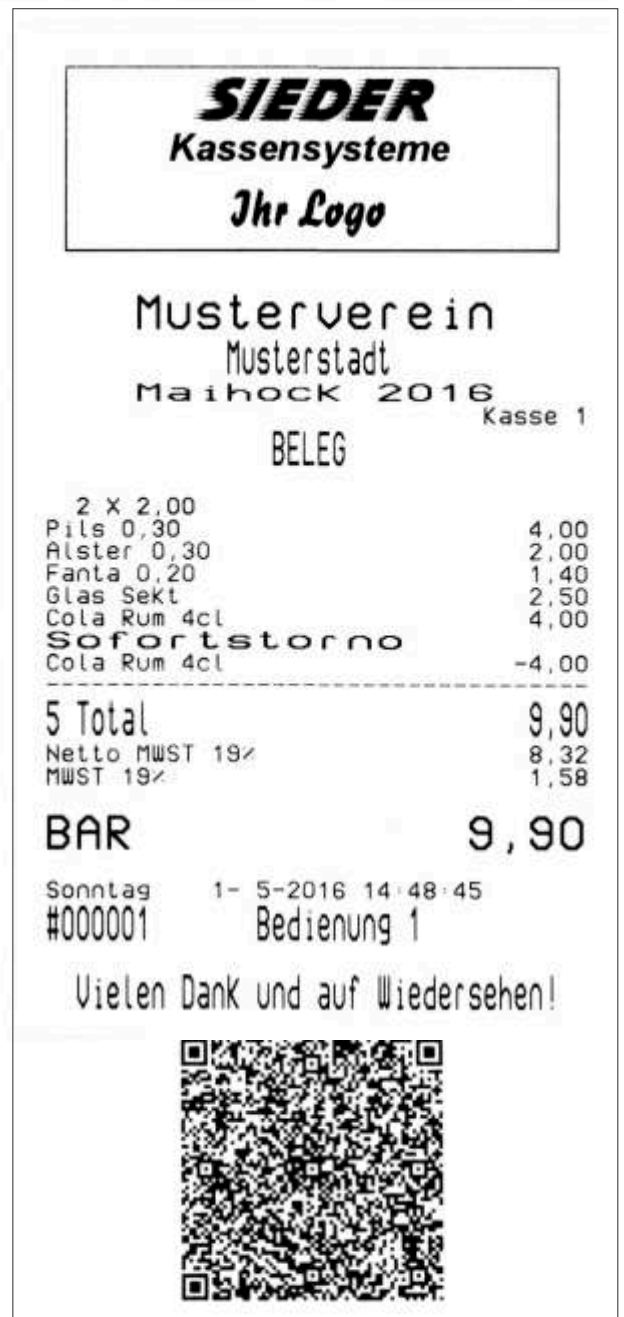
Einzelbon mit Pfand auf Bon

Musterverein Maihock 2016 K1 Pils 0,30 2,00 +PFAND GLAS 2,00 #000011 Sonntag 1- 5-2016 14:45:14 Bedienung 1